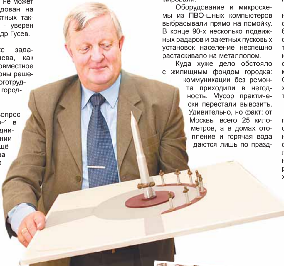
Подготовил Ник. Гошко

Прозябающие в Одинцово-1 офицеры и их семьи боятся, что в один прекрасный день их выселят на улицу, а территорию продадут под дачные участки.