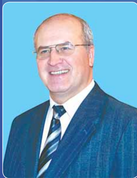
Александр ГУСЕВ, мэр города Одинцово

Пасхальной радости всем вам, и пусть она хранится в сердце до следующей Пасхи, давая силы, уверенность и надежду, помогая преодолевать трудности жизненного пути.